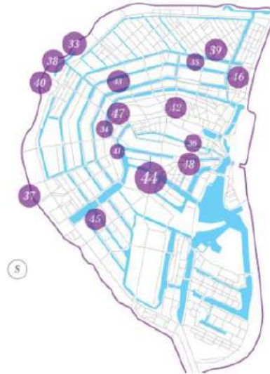
Cartographie olfactive d'Amsterdam